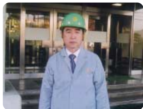
ステンレス高騰問題について 日新製鋼周南事業所へ視察