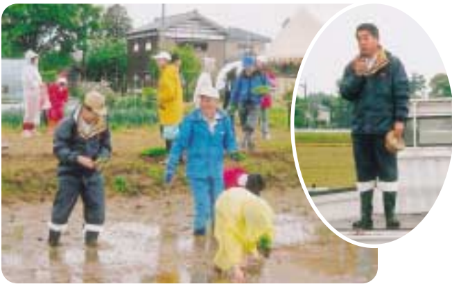
吉田地区田んぼアート参加