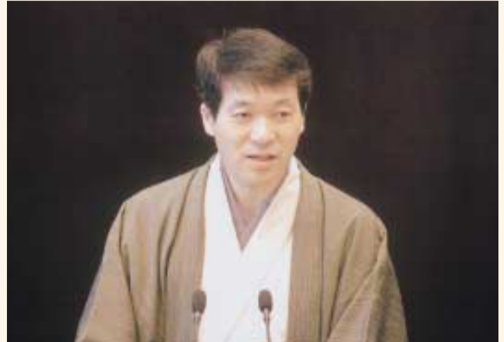
二月定例会初日は知事が和装で出席する慣例です。