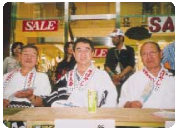
燕市民祭民謡流し