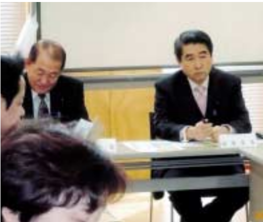
県央地域にも重要な課題である救 命救急センターについて、全国的 にも数少ない独立型の救命救急セ ンターの千葉県救急医療センター を視察