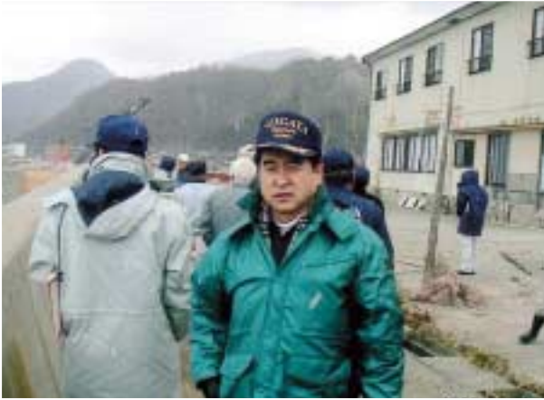
冬季風浪被害に見舞われた佐渡へ 議会の合間を縫って被害状況を 視察