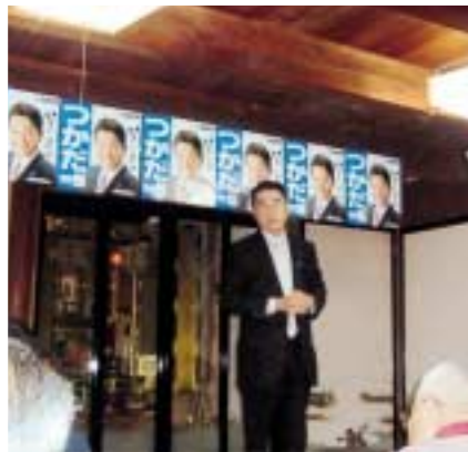
参議院選挙の応援