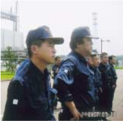
中越沖地震発生(7/16)原発を視察

中越沖地震の早期復旧・復興に要する経費を含む総額一、六七五億円を増額する一般会計補正予算を可決。 「新潟・福岡線」の継続運航を求める決議を全会一致で可決し関係機関に送付。