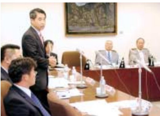
21年ときめき新潟国体について 委員会にて当局に質問